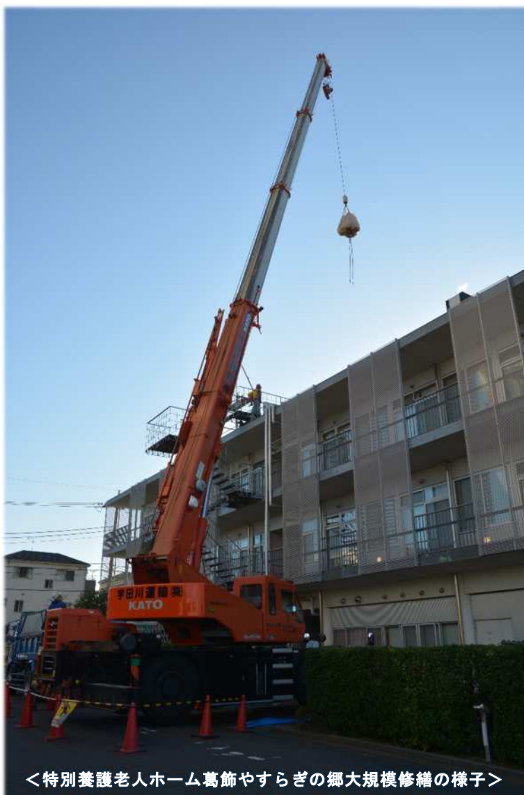
<特別養護老人ホーム葛飾やすらぎの郷大規模修繕の様子>

「法人の基本理念」に沿って、これからも福祉サービスを必要とする人々が、社会、経済、文化その他のあらゆる活動に参加する機会を得ることができるよう、総合的で質のよいサービスの提供をめざします。