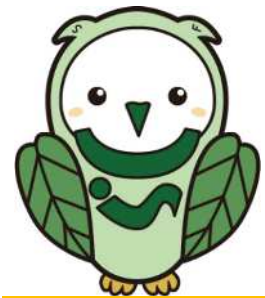
すこやか福祉会 イメージキャラクター すこふくちゃん

日々の取り組みを情報収集し、SNSでの定期発信を行ってきました。新たに採用専用ホームページを作成することを確認しました。法人ホームページと合わせ定期的な更新と発信を行なうことや広報委員会の強化が課題です。