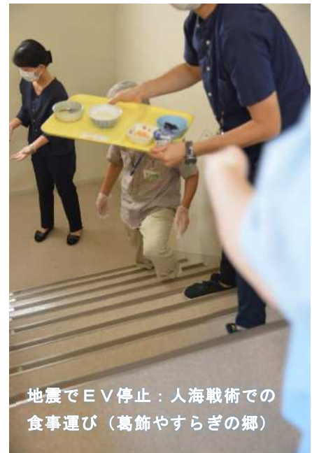
地震でEV停止：人海戦術での食事運び（葛飾やすらぎの郷）

今年度は災害対策としての「事業継続計画」の重要性は理解しつつも作成には至りませんでした。早急に危機管理対策や感染対策の具体化と対応が必要です。また、新たに感染症対策としてのBCPの作成も課題です。