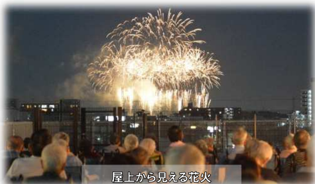
屋上から見える花火