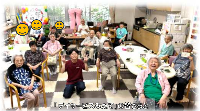
「デイサービスみため」の皆さまと

2023 年 11 月に法人合併し、そのタイミングで南部エリアマネジャーとなり、あっという間に 1 年が経過しました。