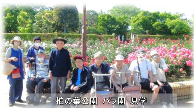
柏の葉公園 バラ園 見学