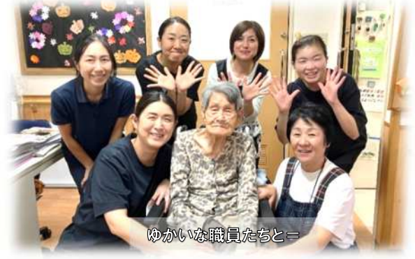
ゆかいな職員たちと＝

昨年の 11 月法人合併により、すこやか福祉会の仲間になりました。あっという間に 1 年が経ちました。