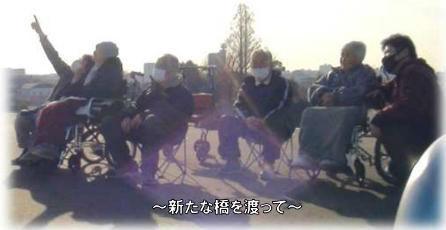
～新たな橋を渡って～

小規模多機能サービスひまわりの家は、千葉県流山市の北西部、三輪野山という地域に 2007 年 8 月に開設されてから、今年で 17 年目を迎えました。