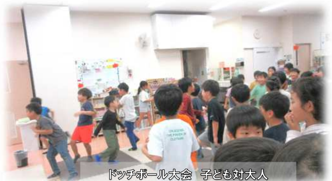
ドッチボール大会 子ども対大人