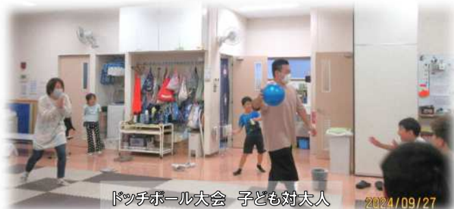
ドッチボール大会 子ども対大人