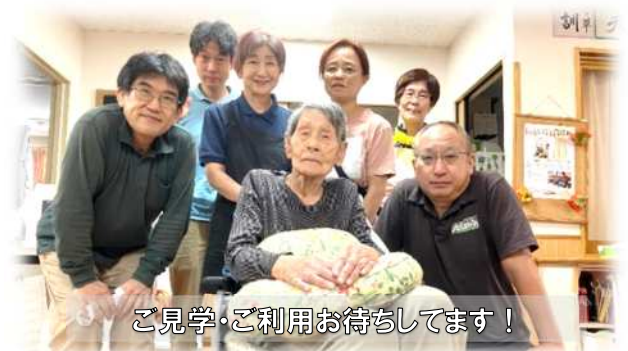
ご見学・ご利用お待ちしております！