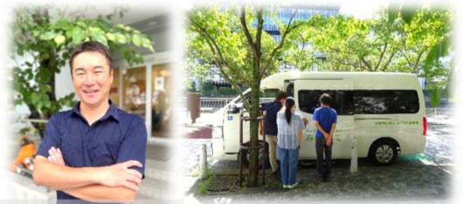
笑顔が素敵な湯岡所長

デイサービスセンターみたては品川から 15 分の距離に位置し、目の前は運河で桜並木に面し、四季の移り変わりを感じられる癒しの空間になっています。