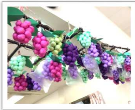
特別賞：『秋の収穫 葡萄棚』 デイサービスセンターなごみ