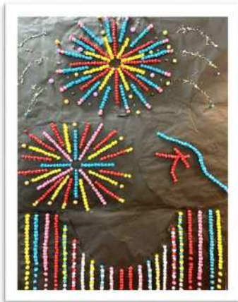
団体：『京都の思い出』 デイサービスセンターみたて