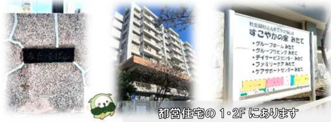
都営住宅の 1・2F にあります

2024 年の夏には 3 日間の大イベント「夏祭り」を開催。約 80 人のボランティアの方々が参加し、子どもたちも遊びに来る賑やかなイベントです。この期間は 3 日間の臨時利用も可能なので、普段とは違う特別な時間を楽しむことができます。