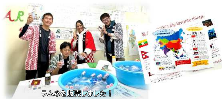
ラムネを販売しました！

千住介護専門学校は、日本を含む約9つの国籍からなる海外留学生が多数在籍しています。先日開催された学園祭で、私もCMH委員としてラムネ飲料の販売+実際に参加し、異文化が交錯する中、温かな交流と新たな発見に満ちた一日となりました。