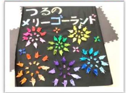
団体：『鶴のメリーゴーランド』 デイサービスセンター采女の里