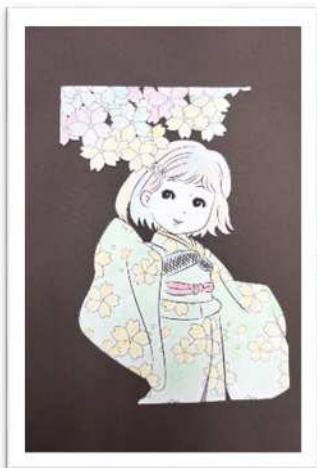
個人：『101歳、入魂！！』 デイサービスセンターかなまち 持丸 千代子様