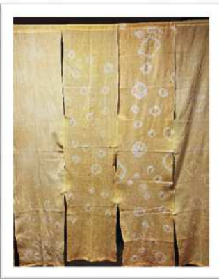
団体：『玉ねぎ染めの暖簾』 デイサービスセンターさくら草