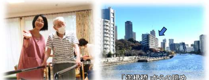
「御楯橋」からの眺め