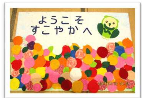
団体：『ようこそ！すこやかへ』 デイサービスセンターすこやか