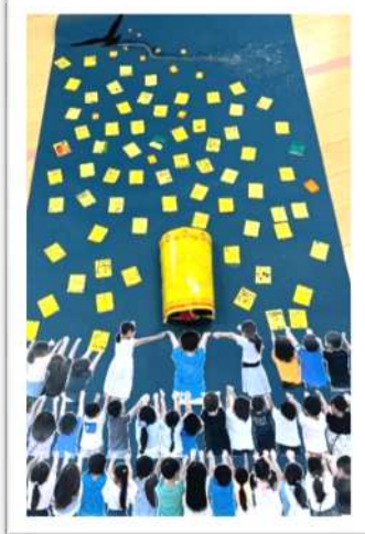
特別賞：『未来を照らす光～平和の想い、ランタンに乗せ～』 つばさ学童保育クラブ