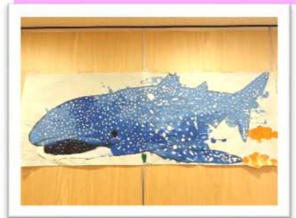
団体：『巨大ジンベイザメ』 野のはな保育園