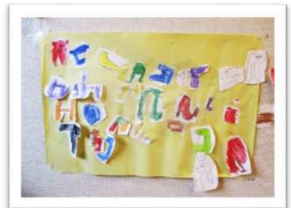
個人：『大好きな ABC』 八潮かえで保育園 島貫 やすはる様